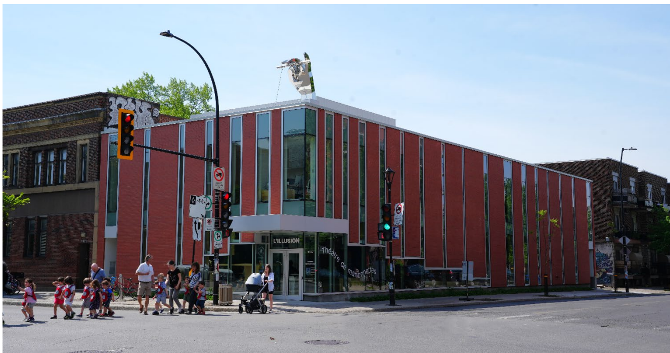
L'illusion, Mai 2024

Inauguré en septembre 2023, il est doté de deux salles de spectacle qui permettent de rendre accessible des spectacles professionnels à un plus grand nombre de jeunes et représente un lieu d'accueil et des conditions de travail optimales pour les artistes. De plus, il pérennise un espace culturel unique , ancré au cœur de la cité, et contribue au rayonnement de la culture québécoise sur la scène nationale et internationale.